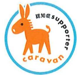
認知症サポーターキャラバン

「認知症サポーター養成講座」を受講した人は「認知症サポーター」となり、認知症サポーターの証でもあるオレンジリングが贈呈されます。