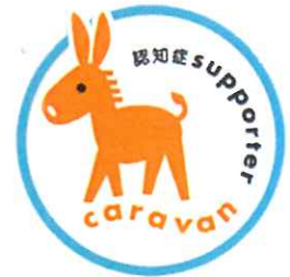
認知症サポーターキャラバン

「認知症サポーター養成講座」を受講した人は「認知症サポーター」となり、認知症サポーターの証でもあるオレンジリングが贈呈されます。