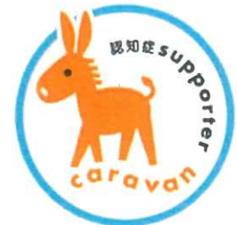
認知症サポーターキャラバン

「認知症サポーター養成講座」を受講した人は「認知症サポーター」となり、認知症サポーターの証でもあるオレンジリングが贈呈されます。